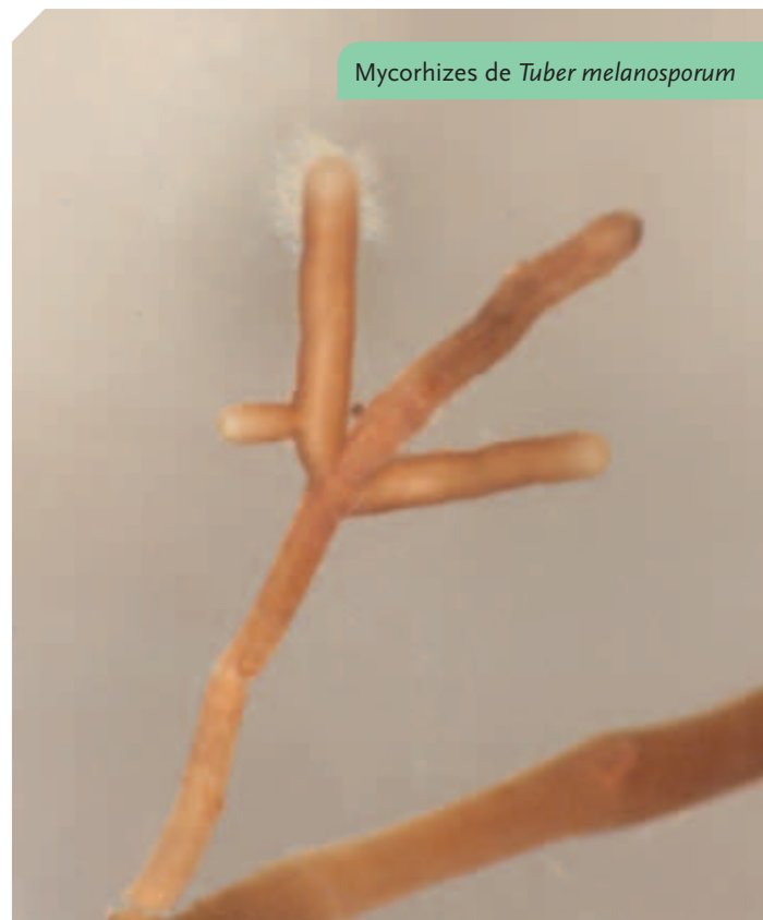
Mycorhizes de Tuber melanosporum

Dans le cadre de son activité de « certification », le Ctifl réalise également le contrôle de plants truffiers mycorhizés chez les pépiniéristes volontaires à ce dispositif. Les plants contrôlés et acceptés garantissent un niveau de mycorhization élevé ainsi qu'une pureté de mycorhization. L'étiquette Ctifl Référence® que le pépiniériste appose lui permet de commercialiser des plants de qualité reconnue.