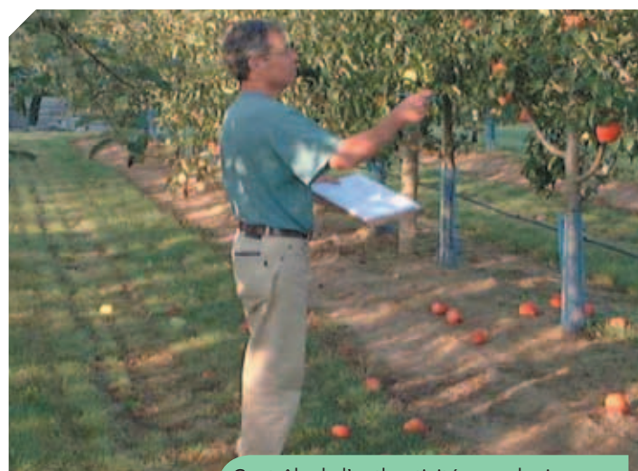
Contrôle de l'authenticité pomologique des plantes mères initiales

Parallèlement à l'activité de certification, la sélection conservatrice a poursuivi en 2015 le développement de son activité d'exportation de matériel végétal fruitier expérimental hors de l'Union Européenne : USA, Chili, Australie, Afrique du Sud. Le centre Ctifl de Lanxade a été reconnu centre d'exportation offshore de matériel Prunus et Malus par le Ministère Néozélandais. L'obtention de cet agrément permettra aux éditeurs/obteneurs français (voire étranger) d'introduire du matériel végétal fruitier avec une quarantaine réduite.